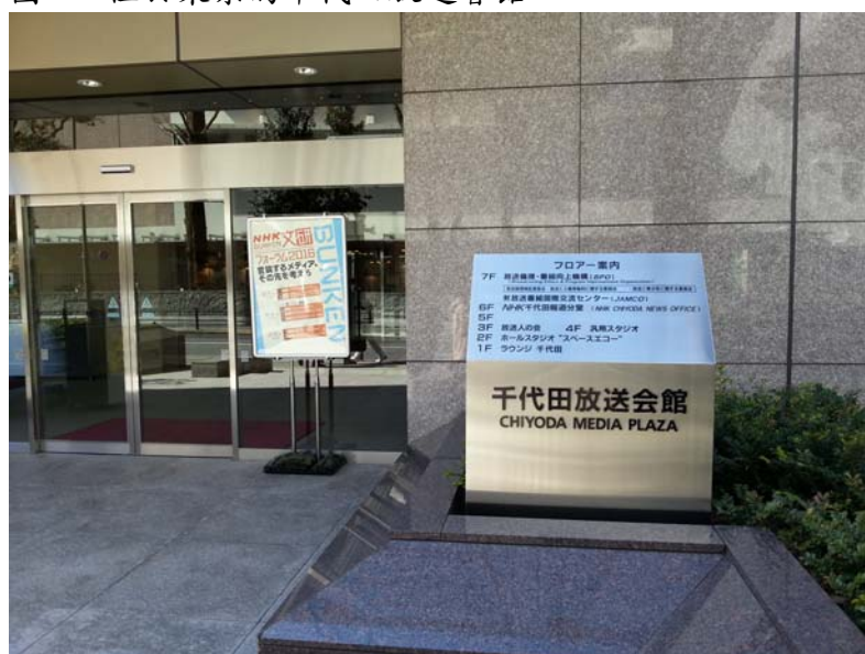
圖 1：位於東京的千代田放送會館

此次前往日本東京共 5 天 4 夜，出國主旨為出席 NHK 放送文化研究所主辦之研討會。「NHK 文研 Forum 2016」於 3 月 1 日（二）起至 3 月 3 日（四）於千代田放送會館舉行，研討會的主題包括：「OTT 將如何改變媒體產業」、「從文研調查看動畫使用現況」、「今後的電視演變」、「構思廣播電視 100 年史」、「新 NHK 音調詞典的重點解說」、「如何為大規模水災作準備」、「從時間看日本人的生活」、「震災影音資料今後的再利用」等議程。與會來賓包括「NHK 研究員」、「BBC Worldwide 資深副總」、「亞馬遜日本/數位影像部長」、「總務省官員」、「東京大學」等四所大學學者、「日本時間學會理事」、「國立國會圖書館主任」等專業人士。本報告依研討會議程的先後順序作成摘要報告如下。