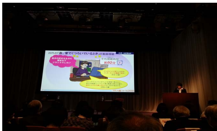
圖 3：說明 20-29 歲年輕人的收視行為

NHK 的研究員塚本恭子就「影音使用者」作調查報告。指出 1.使用者在看什麼?2.如何收視?3.20-29 歲的使用者收視的原因?20~59 歲的使用者中只有 15%在收看付費的影音內容。不看付費影音最大的原因是日本的收費偏高。使用者最常收看的是數分鐘長度的短版的影音內容，最常收視的內容類型分別為 1.個人上傳的影音 2.電視節目影音 3.音樂影音。網路收視的裝置中，15~19 歲的使用者有 51%透過智慧型手機收視，20~29 歲的使用者有 57%透過桌機，年齡愈大使用桌機的比例愈高。各年齡層透過平板收視的皆為個位數。20~29 歲的使用者通勤/通學中的平均收視時間為 42 分鐘，收視目的是殺時間、忘記壓力。用餐時的平均收視時間為 53 分鐘，收視目的是殺時間、收看錯過的電視節目。晚間返家後的平均收視時間為 92 分鐘，收視目的是希望沉浸於自己喜歡的節目中、達到放鬆。