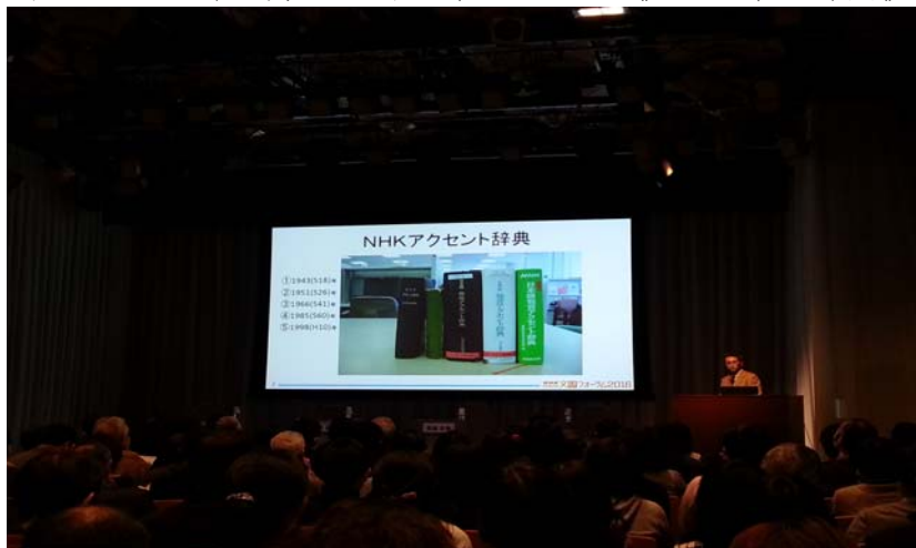
圖 7：NHK 研究員說明新撰即將出版的《NHK 聲調辭典》

第一版的 NHK 聲調辭典始於 1943 年，由於日本當時處於與英美敵對的戰爭狀態中，第一版辭典的特色是不納入以英語為主的外來語的辭彙。其後歷經數次修訂