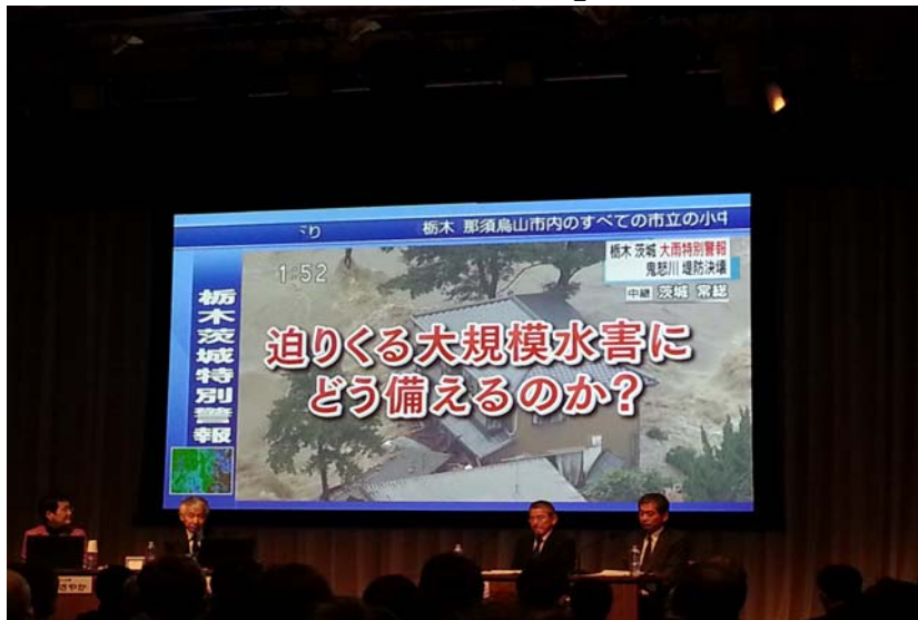
圖 8：探討「如何為大規模水災作準備」的場景

不堪百年一度的豪大雨，2015 年 9 月 10 日 12 時 50 分「鬼怒川」流經茨城縣常總市境內的水域大約 200 公尺長的堤防潰堤。潰堤後經過 46 分鐘 NHK 才率先作了新聞報導，災害應變主管機關「國土交通省」則於潰堤後 1 個小時才舉行記者會。綜合討論時與會來賓指出，地方政府對於水位變化應該迅速正確地掌握，並傳達簡單易懂的資訊給居民。各種媒體(含網路媒體)應該好好地談一談如何報導水災新聞，而電視收音機等媒體應該在潰堤等具體災害發生前就應該播出水災的相關節目(包括 Hazard Map)，使居民有所警覺。從災後所作的居民意識可知，有 89% 的居民開車避難，為避免屆時交通混亂，來賓呼籲政府當局平日即應進行交通疏導的防災演習。有 79% 的居民認為因為居住地過去並無淹水的經驗，所以這次也不會淹水；來賓指出必須提高居民對於當今氣候異常的意識。考量水災發生時有可能已經無法離開自家住宅的情形，呼籲居民應盡可能往往家中地勢較高的地方避難。民眾除了準備居家避難時的飲水食物等民生必需品外，對於停水停電停瓦斯的時間可能長達一週以上也應該要有心理準備。