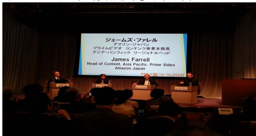
圖 2：「OTT 將如何改變媒體產業」的討論場景

此次研討會對 OTT 的定義是：不透過既有的有線電視或衛星電視，而經由網路提供節目內容的服務。截至 2016 年 1 月，全球 OTT 龍頭 Netflix 所服務的區域已達